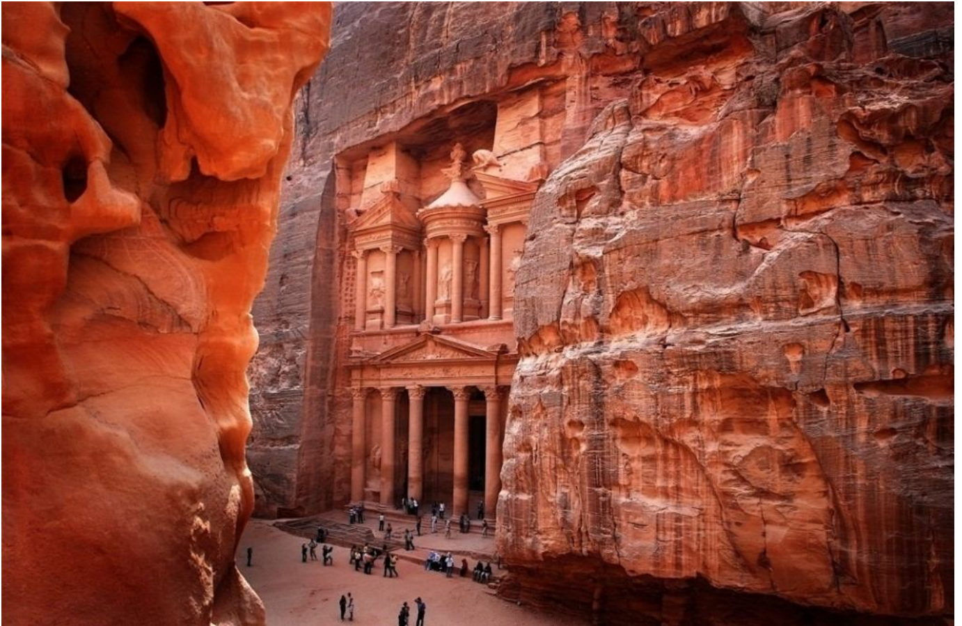
La fachada del Khazné el-Faraun o Tesoro del Faraón