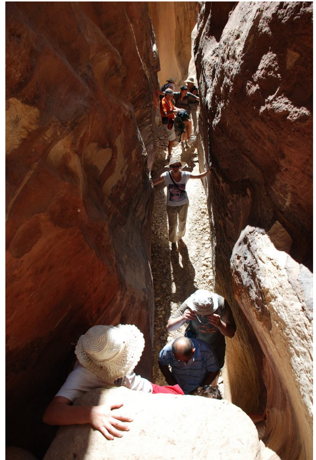
El grupo de 2010 por uno de los más atractivos y desconocidos wadis de Petra