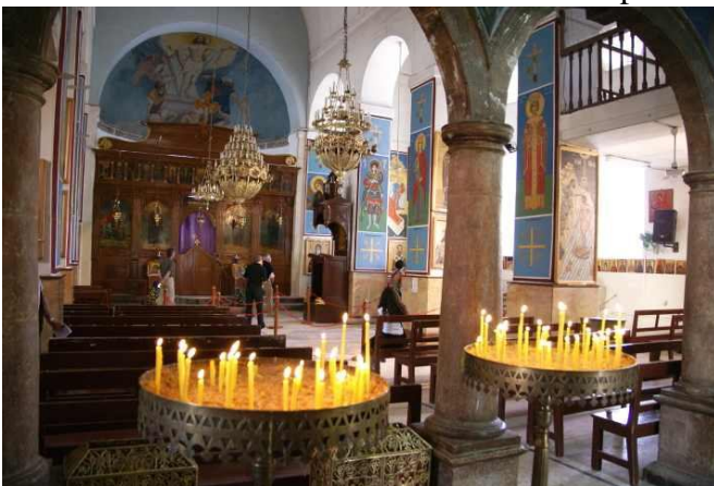
El célebre mapa-mosaico de Madaba

Salida hacia MADABA , para visitar la iglesia ortodoxa de San Jorge, donde se encuentra el famoso mosaico que representa un mapa que recoge desde Egipto a Israel y Palestina. Continuación hacia el MONTE NEBO para admirar la vista panorámica del Valle del Jordán y del Mar Muerto desde la montaña. Este lugar es importante para los creyentes porque se dice que fue el último lugar visitado por Moisés para desde allí ver la tierra prometida. Continuación a UMM AR-RASAS , donde destacan los bellos mosaicos de la Iglesia de San Esteban, del año 785 d.C. Volvemos al hotel junto al Mar Muerto.