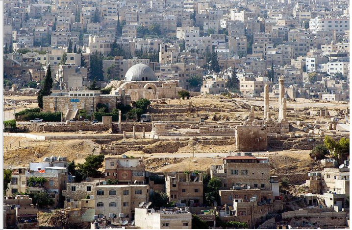
Ciudadela de Amman