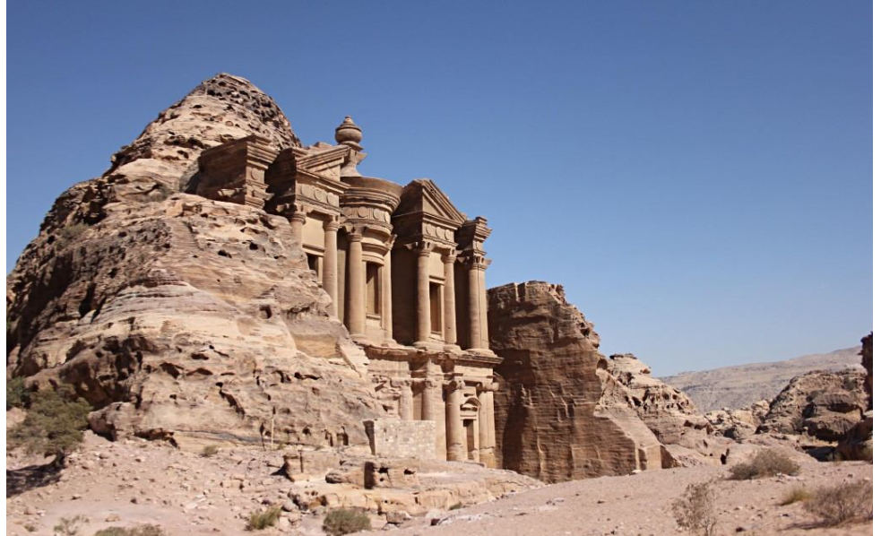
Camino entre Siq el-Barid y Petra.