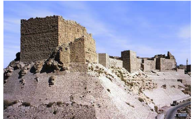
Fortaleza cruzada del Crac de los Moabitas

Al terminar la ruta del Siq, partiremos hacia KERAK . Visita de la fortaleza de los cruzados, conocida como el “Crac de los moabitas”, la más importante de la zona después del “Crac de los Caballeros” en Siria. Continuación a Petra.