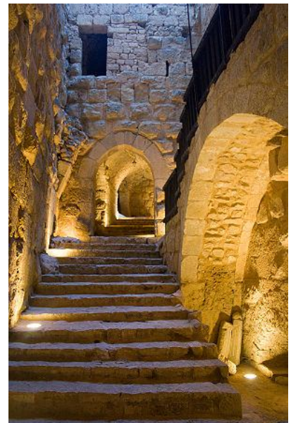
Castillo de Ajlun