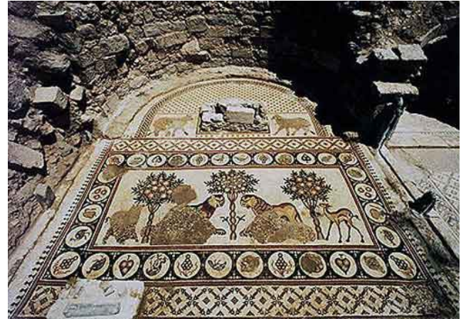
Mosaicos de Umm ar-Rasas