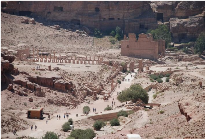
Vía principal hacia Qasr el-Bint

a) Un grupo seguirá al guía local jordano siguiendo la ruta principal por la vía columnada, el gran templo, Qasr el-Bint, etc. en dirección al imponente Ed-Deir, para luego volver sobre sus pasos y salir por el Siq.