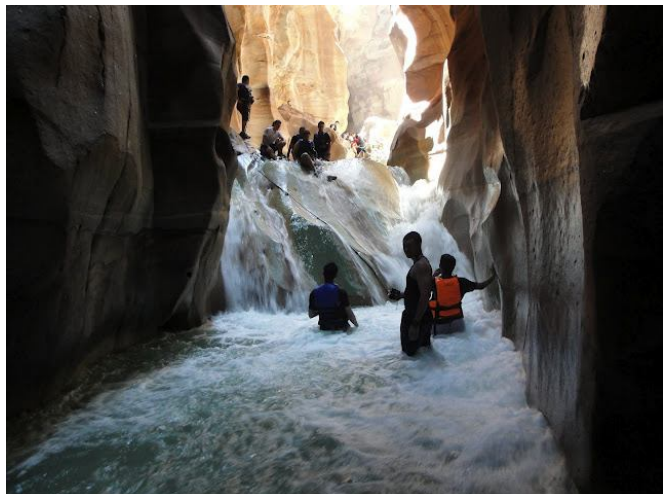
Wadi el-Mujib (ruta del Siq)