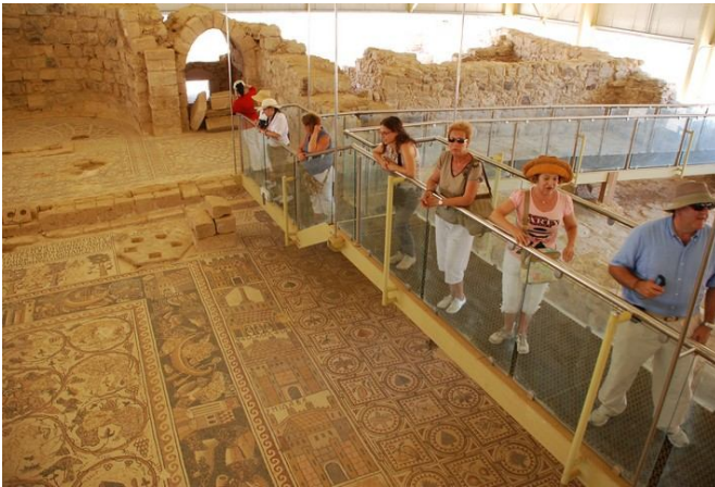
Iglesia de San Esteban, Umm ar-Rasas