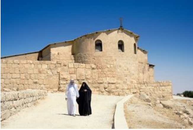
Iglesia de Moisés en el Monte Nebo