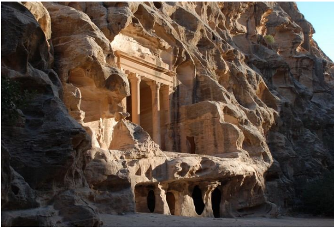
Siq al-Barid (pequeña Petra)