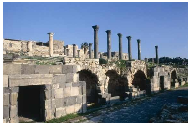
Umm Qais - Gadara

Tras la visita nos desplazaremos hacia GERASA (Jerash), situada a 45 km. al norte de Ammán. Sus ruinas representan una de las ciudades romanas más importantes y mejor conservadas del Próximo Oriente. En 90 d. C. se incorporó a la provincia de Arabia, que incluía la ciudad de Filadelfia (actual Ammán). Los romanos garantizaron la paz y la seguridad en el área, lo que permitió a sus habitantes dedicar su tiempo y sus energías al desarrollo económico y a la construcción. En la segunda mitad del siglo I, la ciudad de Jerash alcanzó una gran prosperidad.