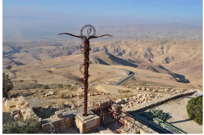
Vista de la Tierra Prometida