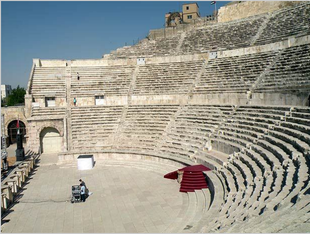
Teatro romano de Amman

En primer lugar realizaremos la visita de la ciudad de AMMAN , capital de Jordania. Nos desplazaremos a la ciudadela y el teatro romano.