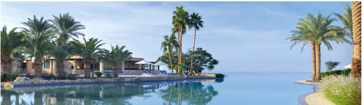
Vista del Mar Muerto desde la piscina de nuestro hotel